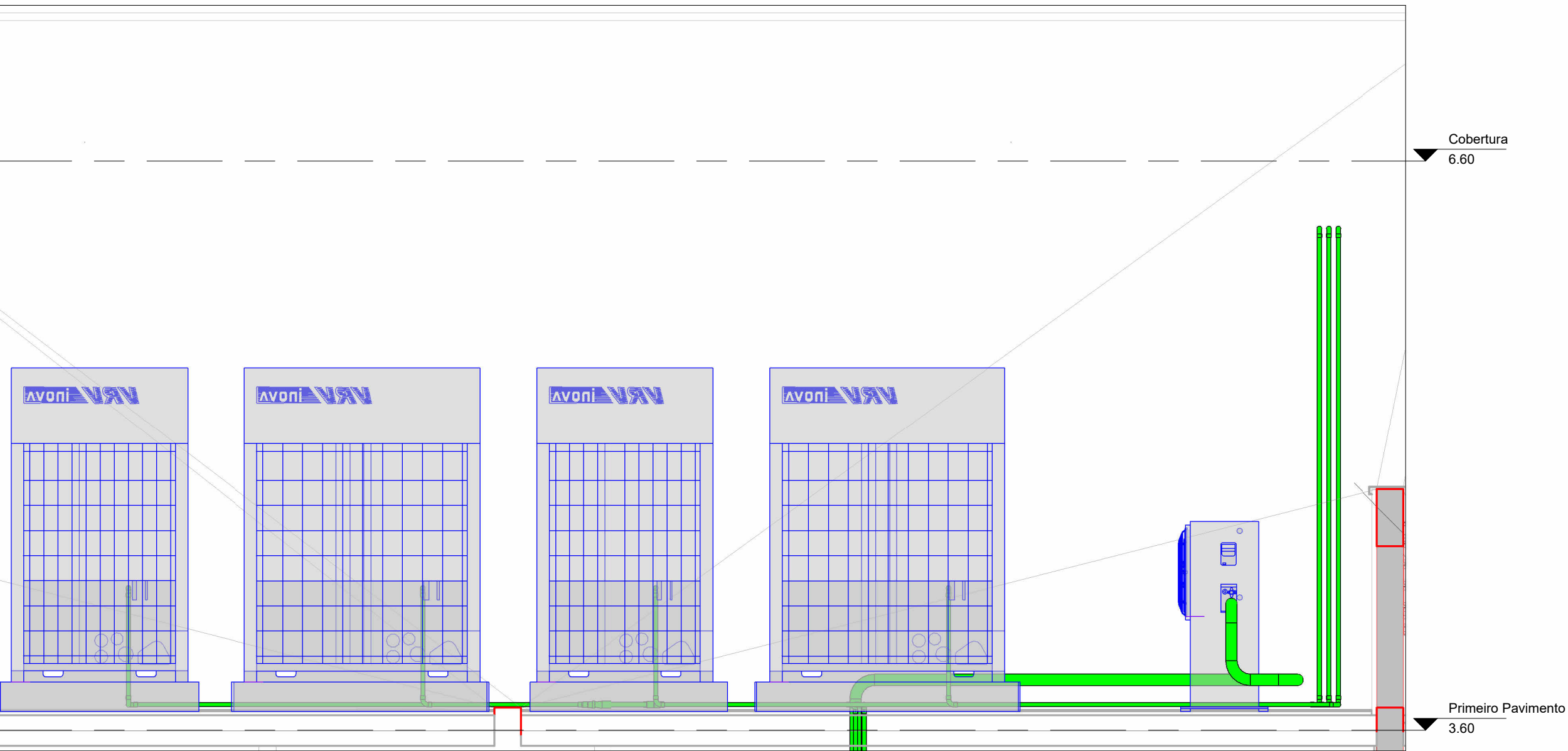
CORTE 02 - CONDENSADORAS